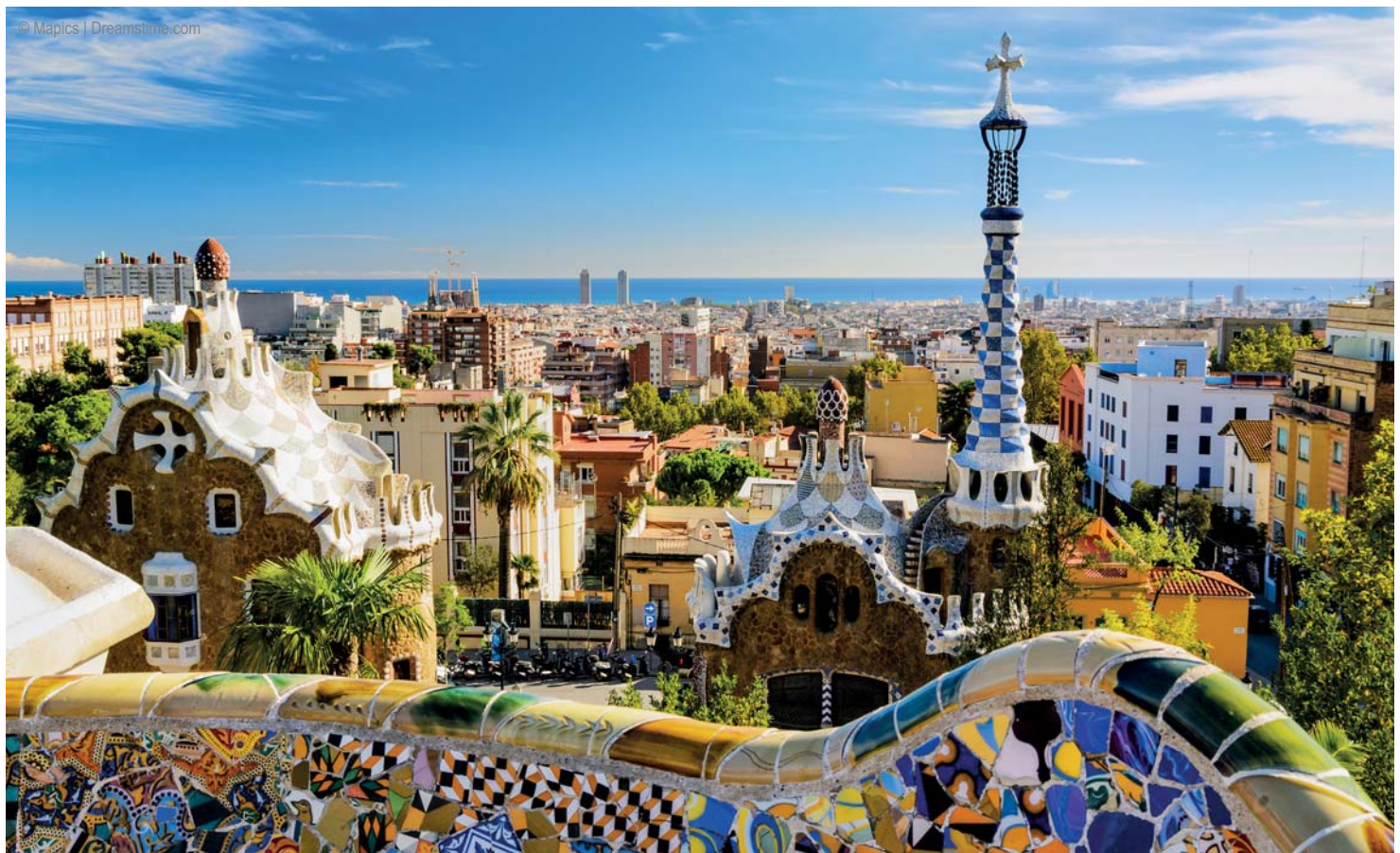
Barcelona - Park Güell