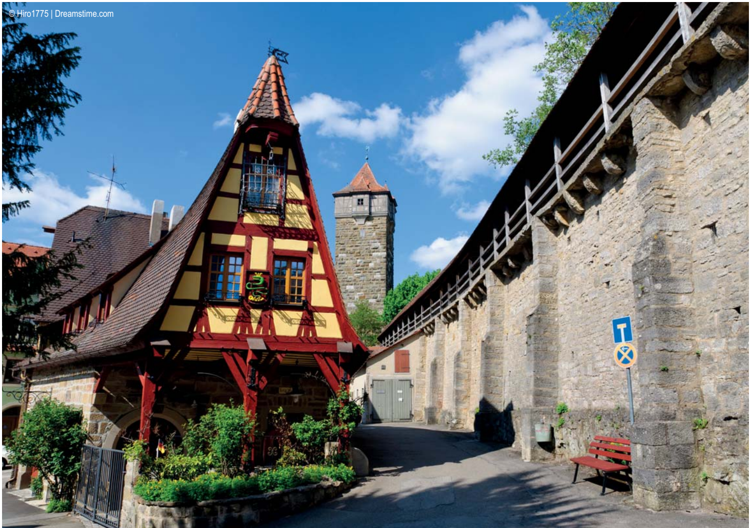
Rothenburg ob der Tauber