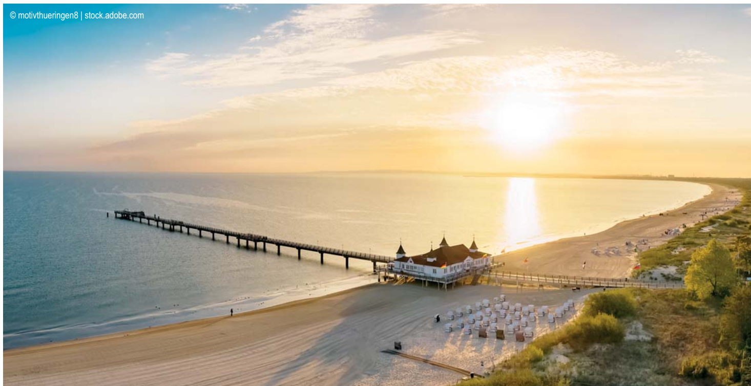
Ahlbeck - Sonnenaufgang am Strand