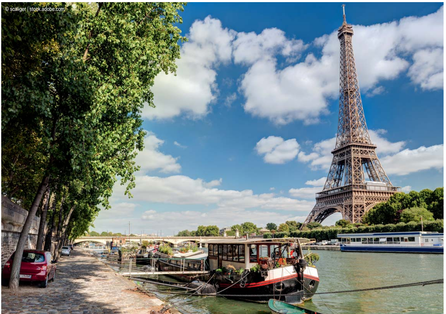
Paris - Eiffelturm