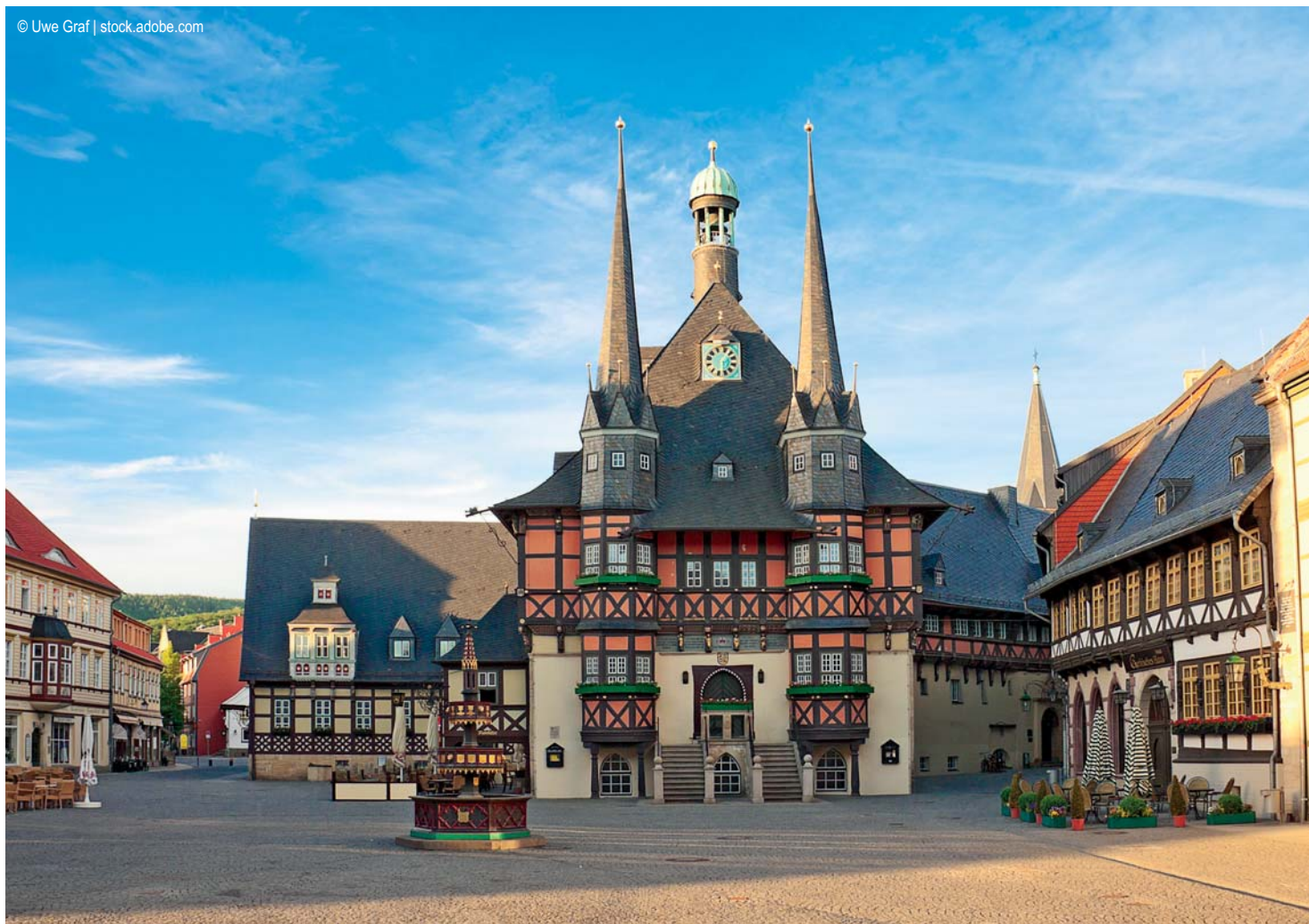
Wernigerode - Rathaus