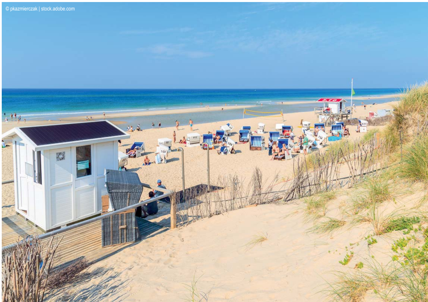
Sylt - Rantum Beach