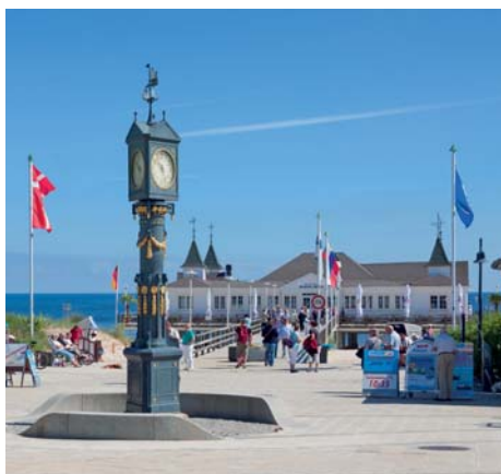
Ahlbeck - an der Seebrücke

Besuch der Halbinsel Fischland-Darß mit dem Nationalpark Vorpommersche Boddenlandschaft. Sie treffen auf kleine Fischerdörfchen, schöne Villen und eine herrliche Küstenlandschaft