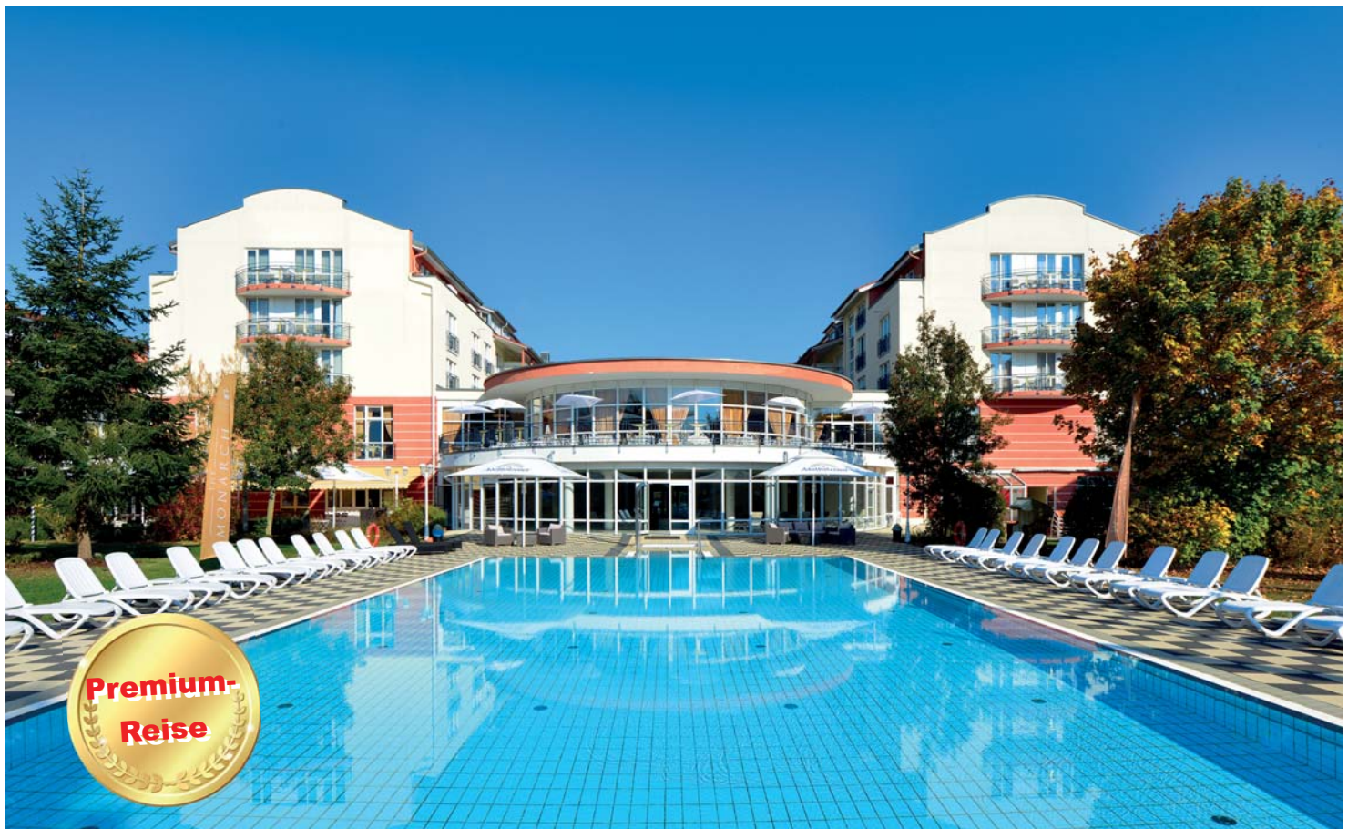
Bad Gögging - Hotel Monarch