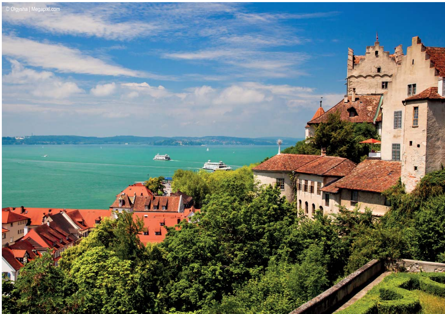
Meersburg - Blick über den Bodensee