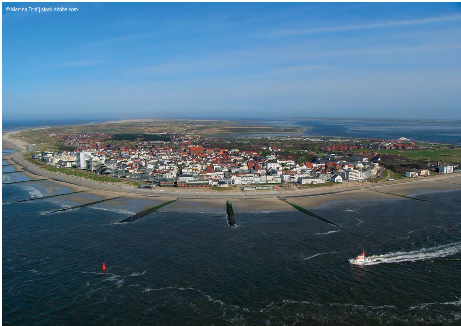
Norderney - Luftaufnahme