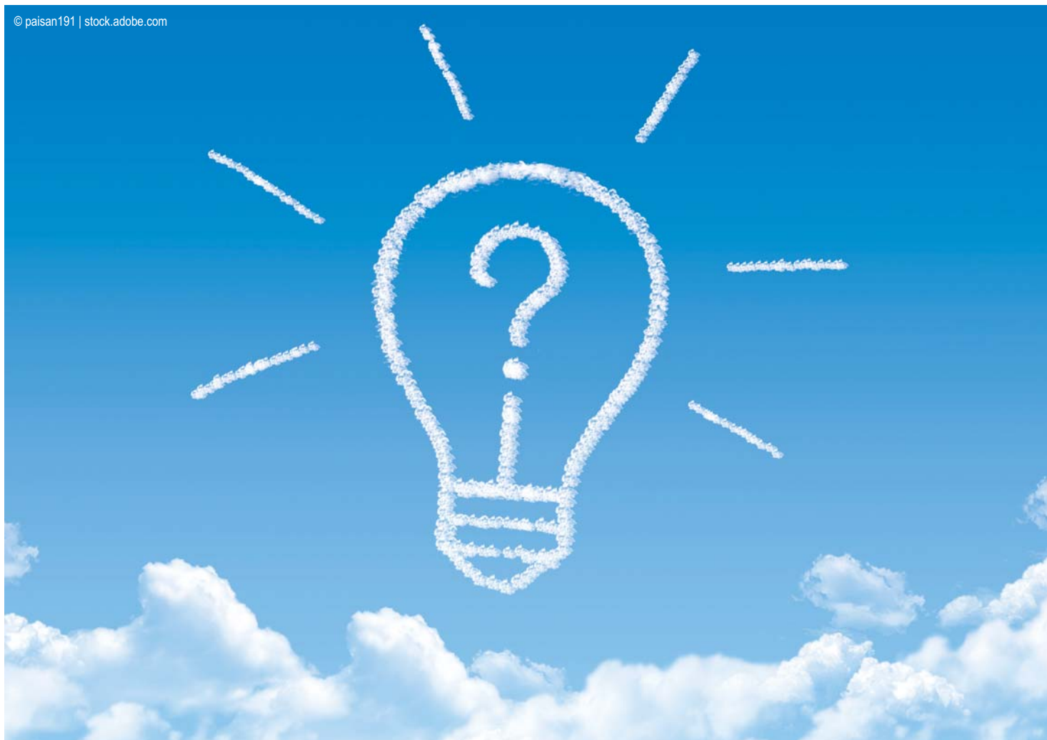
Fahrt ins Blaue