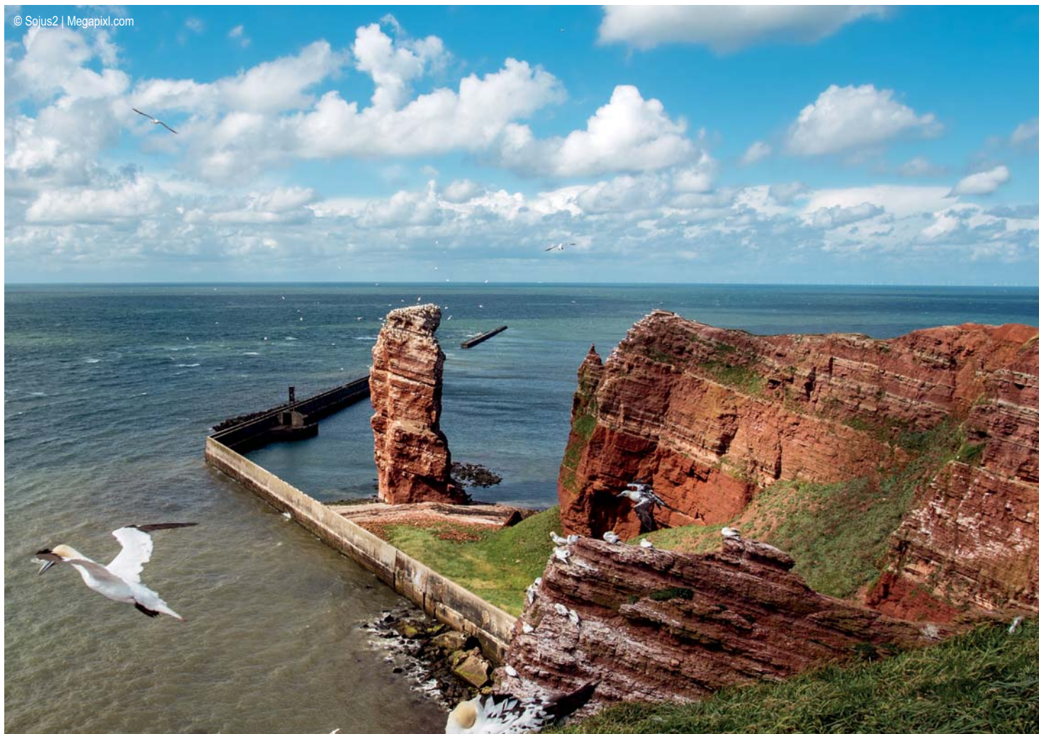
Helgoland - Lange Anna