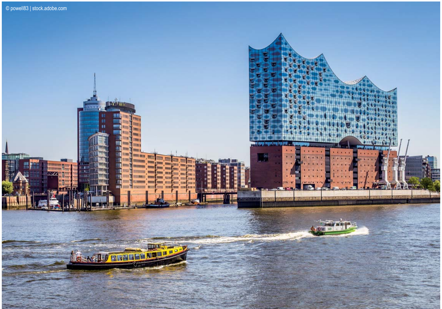
Hamburg - Elbphilharmonie