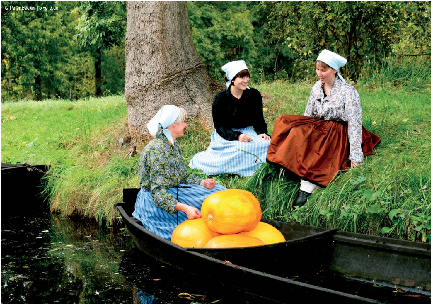
Spree-wald - Kürbisernte