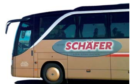
Abfahrtsplan A Seite 2 | Reiseveranstalter Seite 4