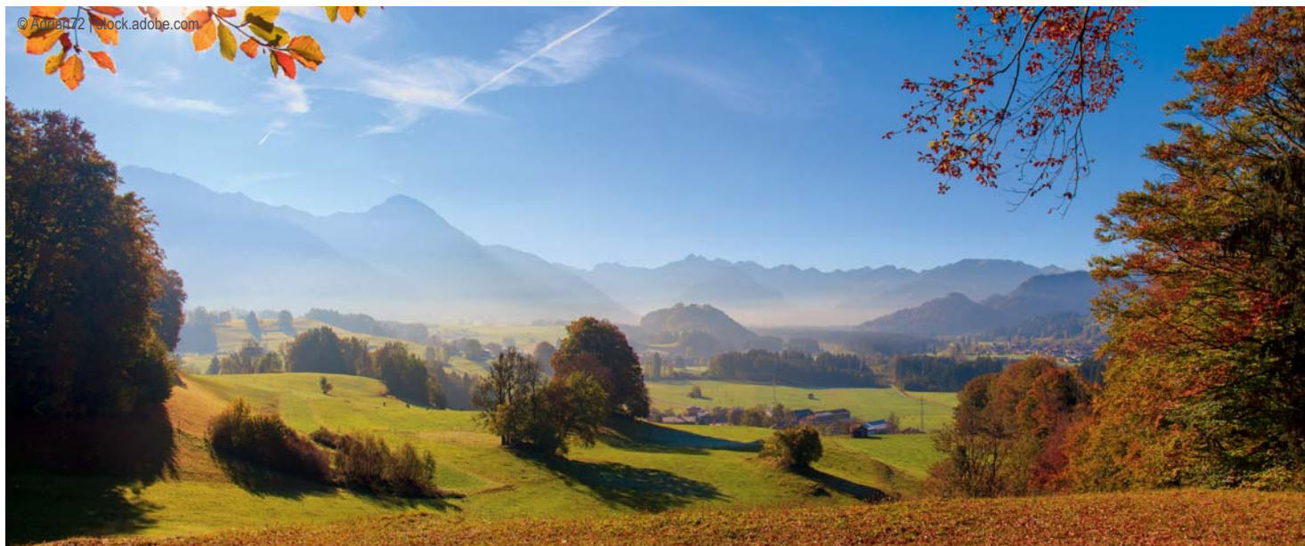
Allgäuer Alpen im Herbst