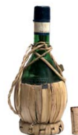
Abfahrtsplan A Seite 2 | Reiseveranstalter Seite 4

Die Citytax von ca. 1,50 €/Person/Nacht ist vom Gast vor Ort zahlenbar