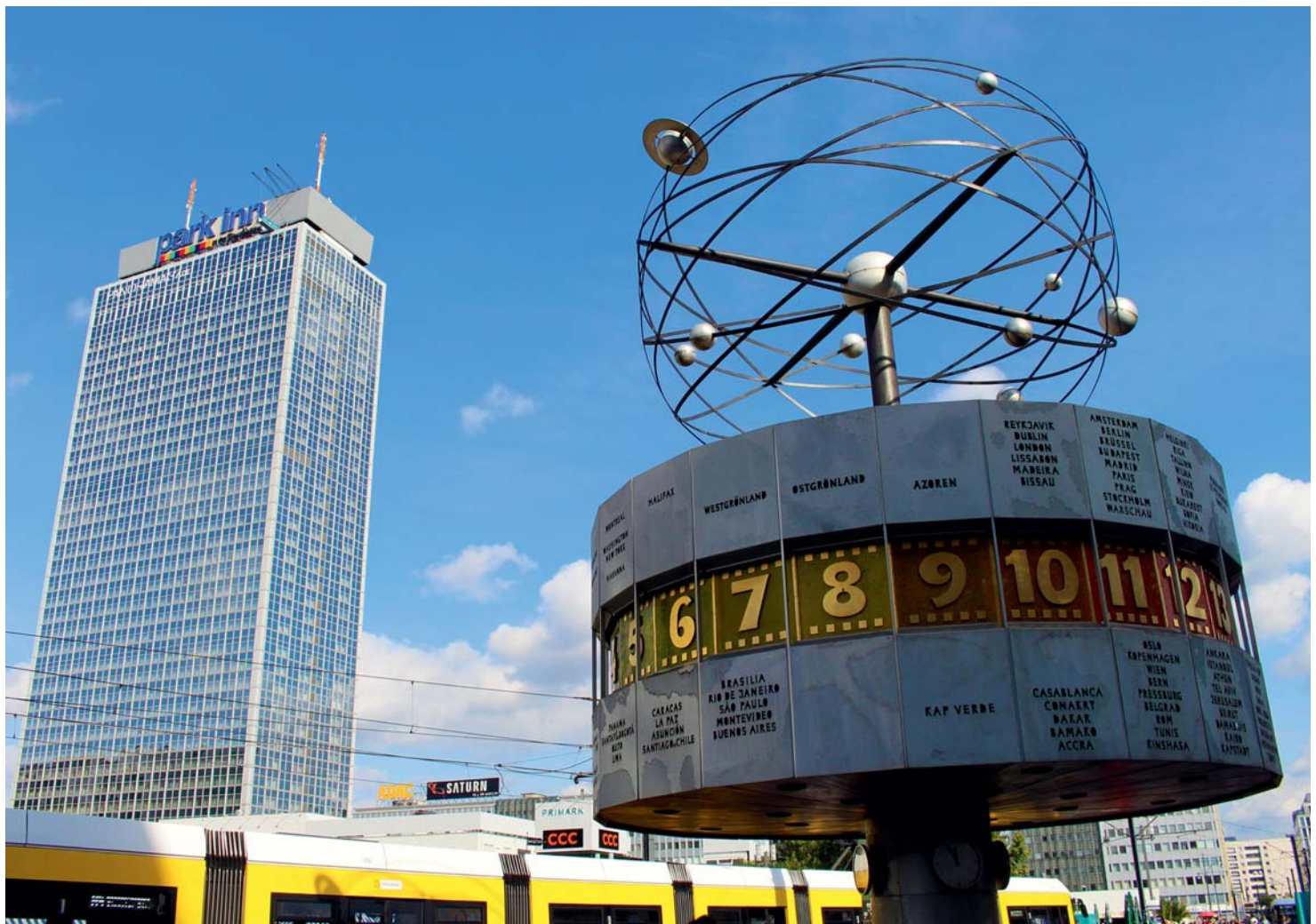
Berlin - Alexanderplatz