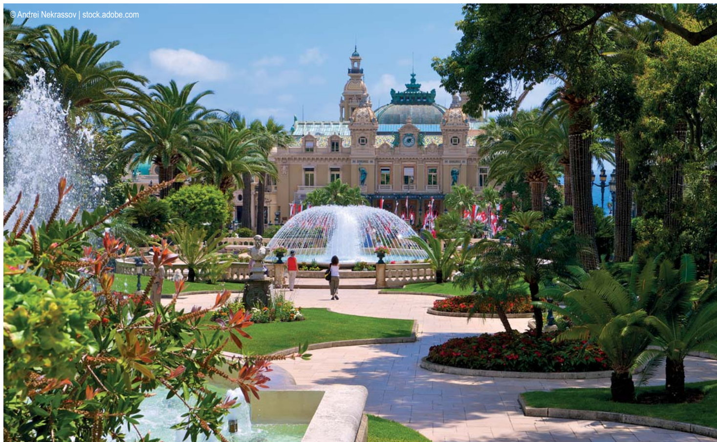
Monte Carlo - Impeccable Garden