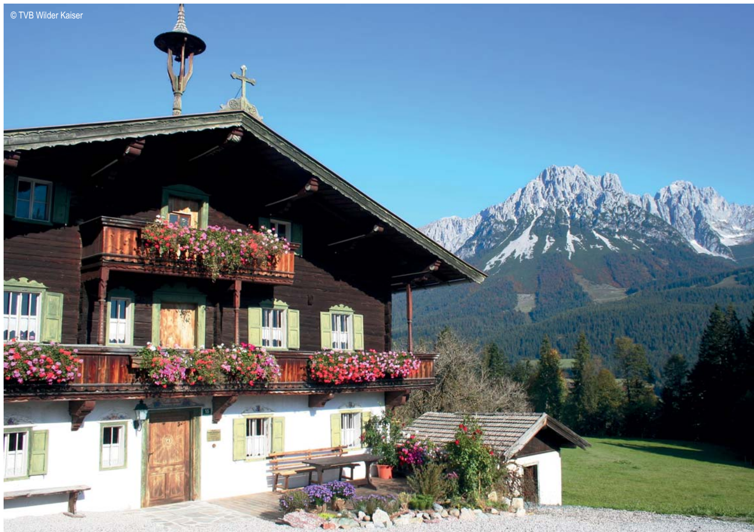
Ellmau - Bergdoktor Haus