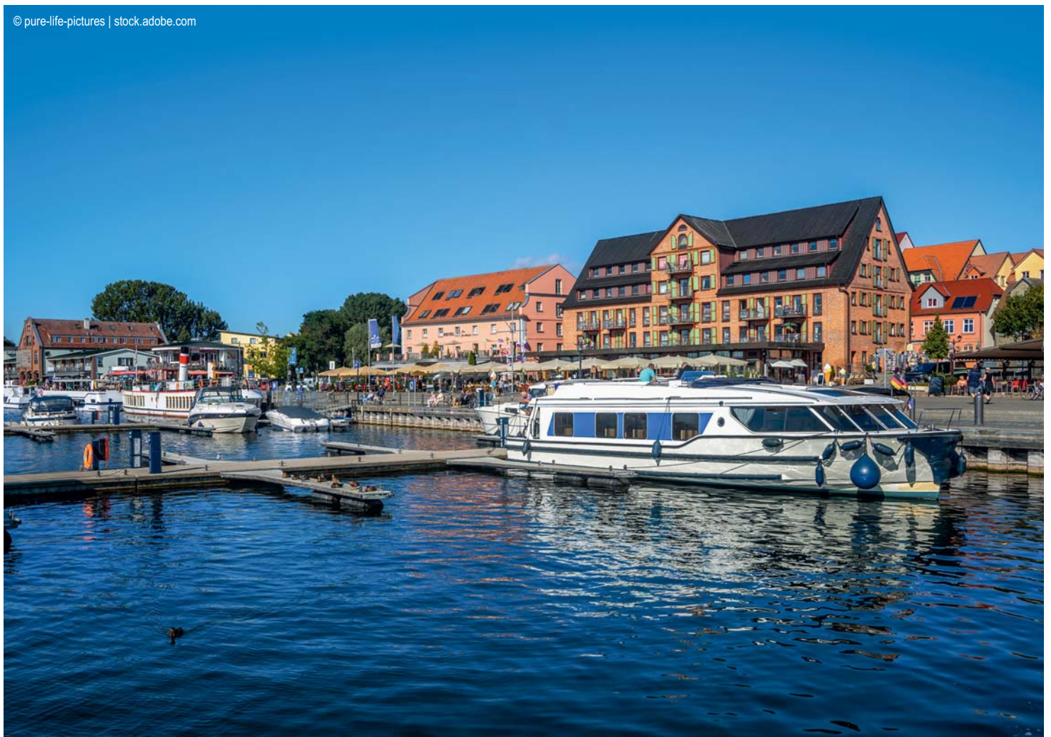
Waren an der Müritz