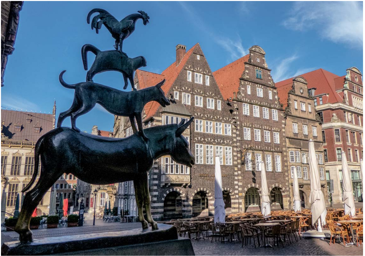
Bremen - Stadtmusikanten