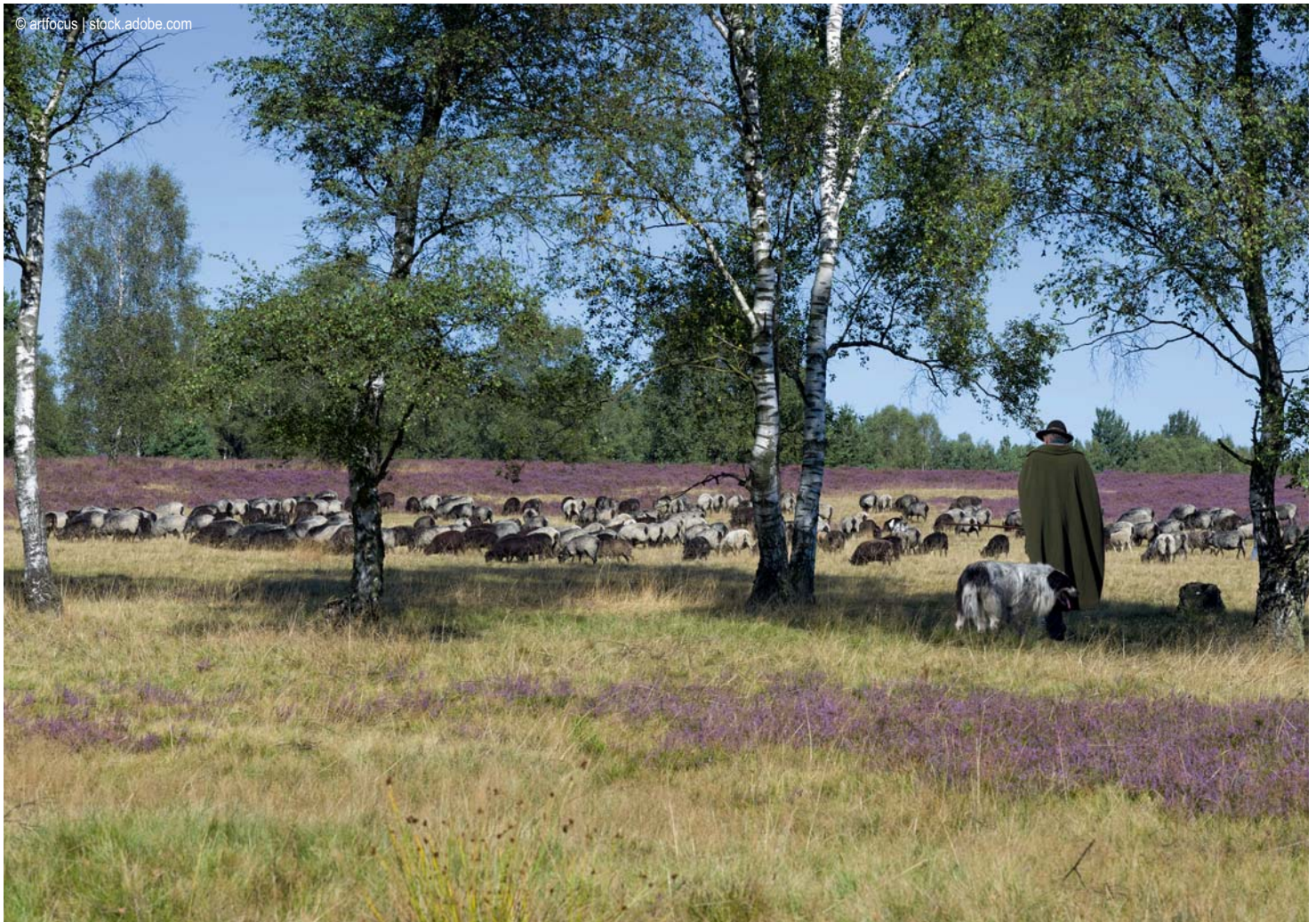
Lüneburger Heide - Schäfer mit Herde