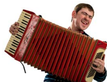
Abfahrtsplan A Seite 2 | Reiseveranstalter Seite 4