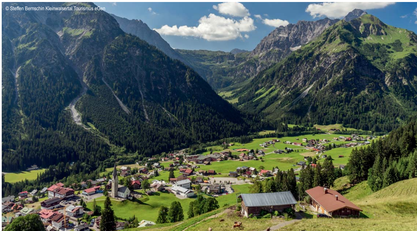
Kleinwalsertal - Mittelberg