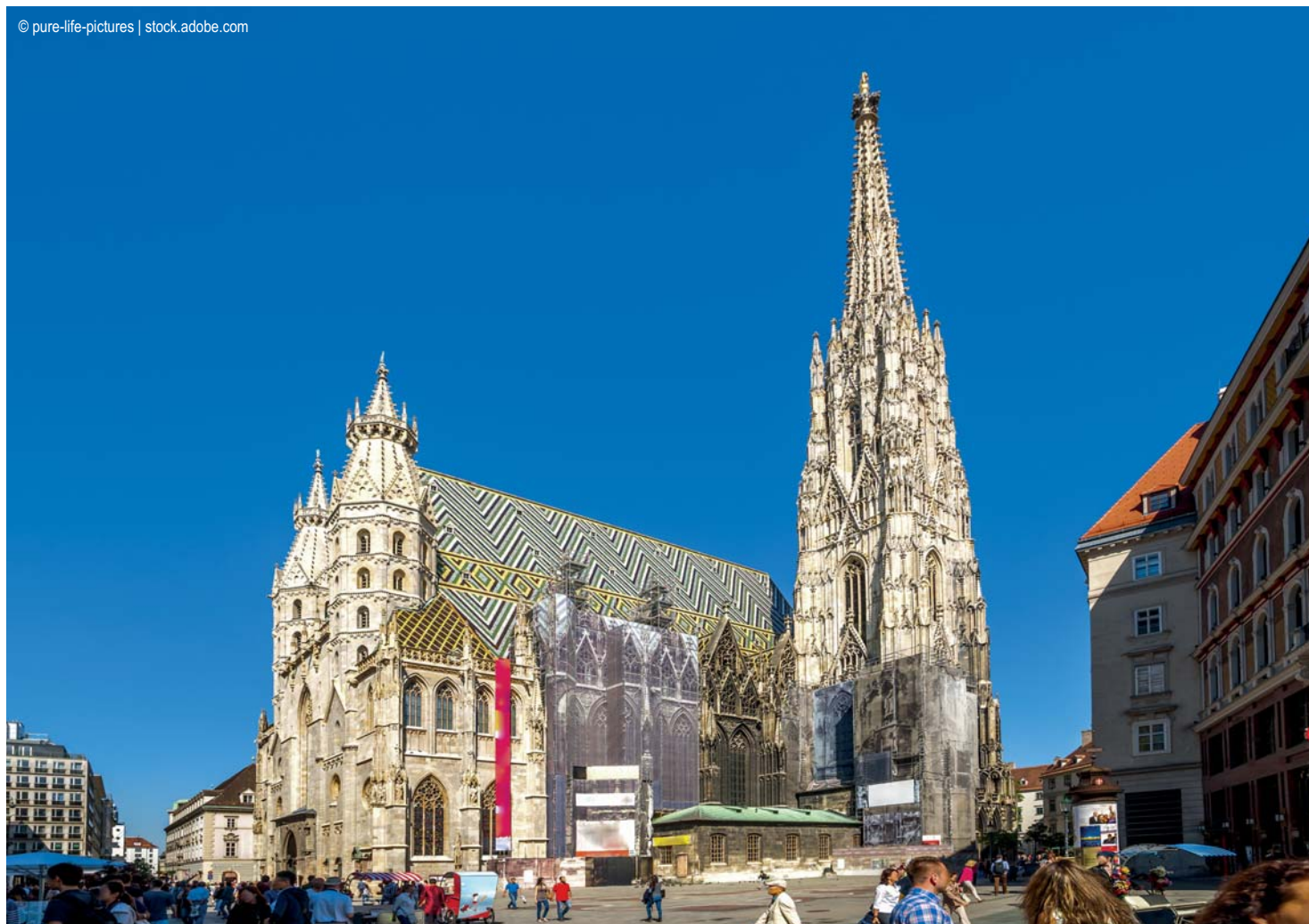
Wien - Stephansdom