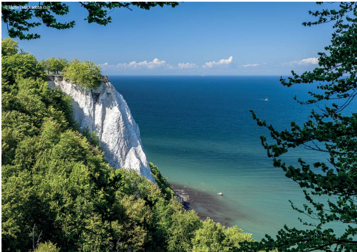
Rügen - Kreidefelsen