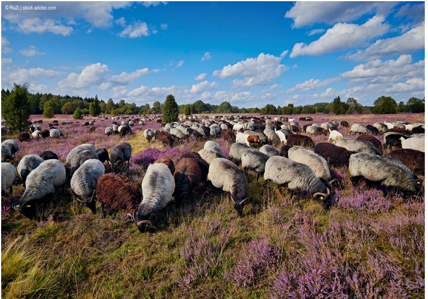
Lüneburger Heide - Heidschnucken