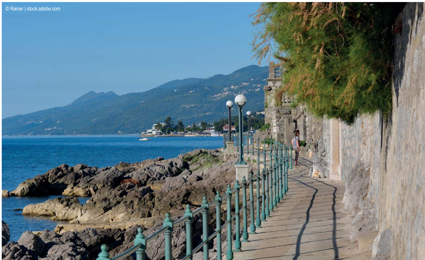
Lungomare bei Opatija