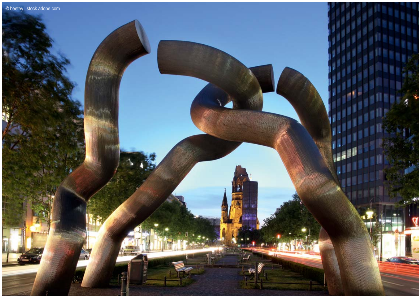
Berlin - Gedächtniskirche