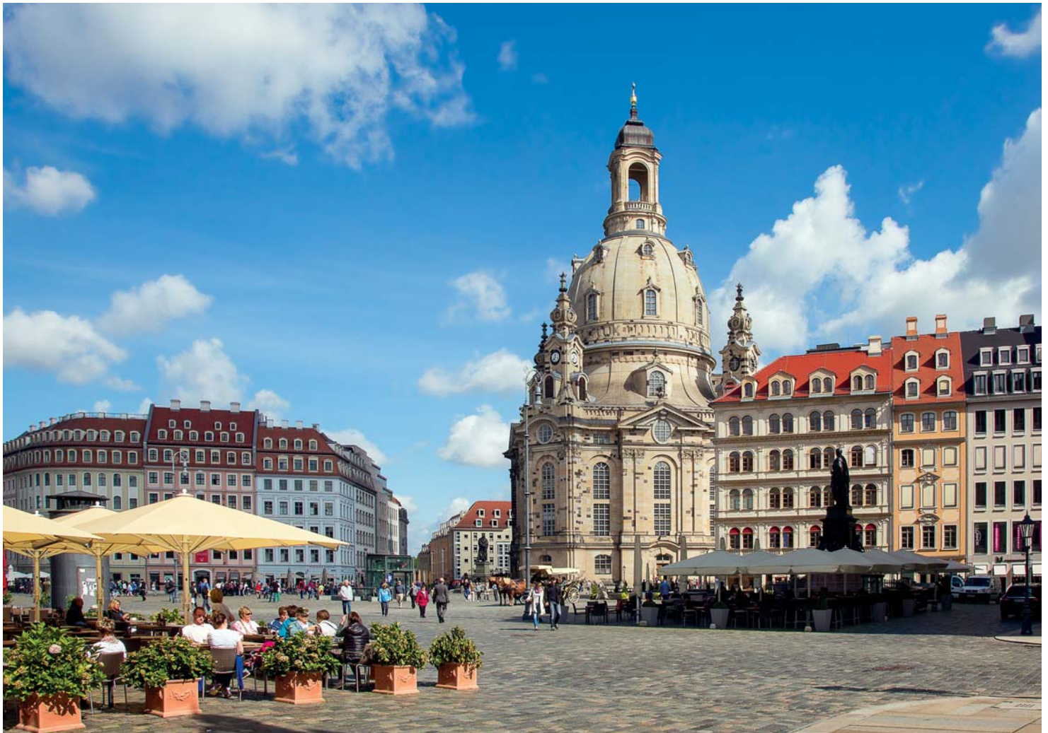
Dresden - Frauenkirche