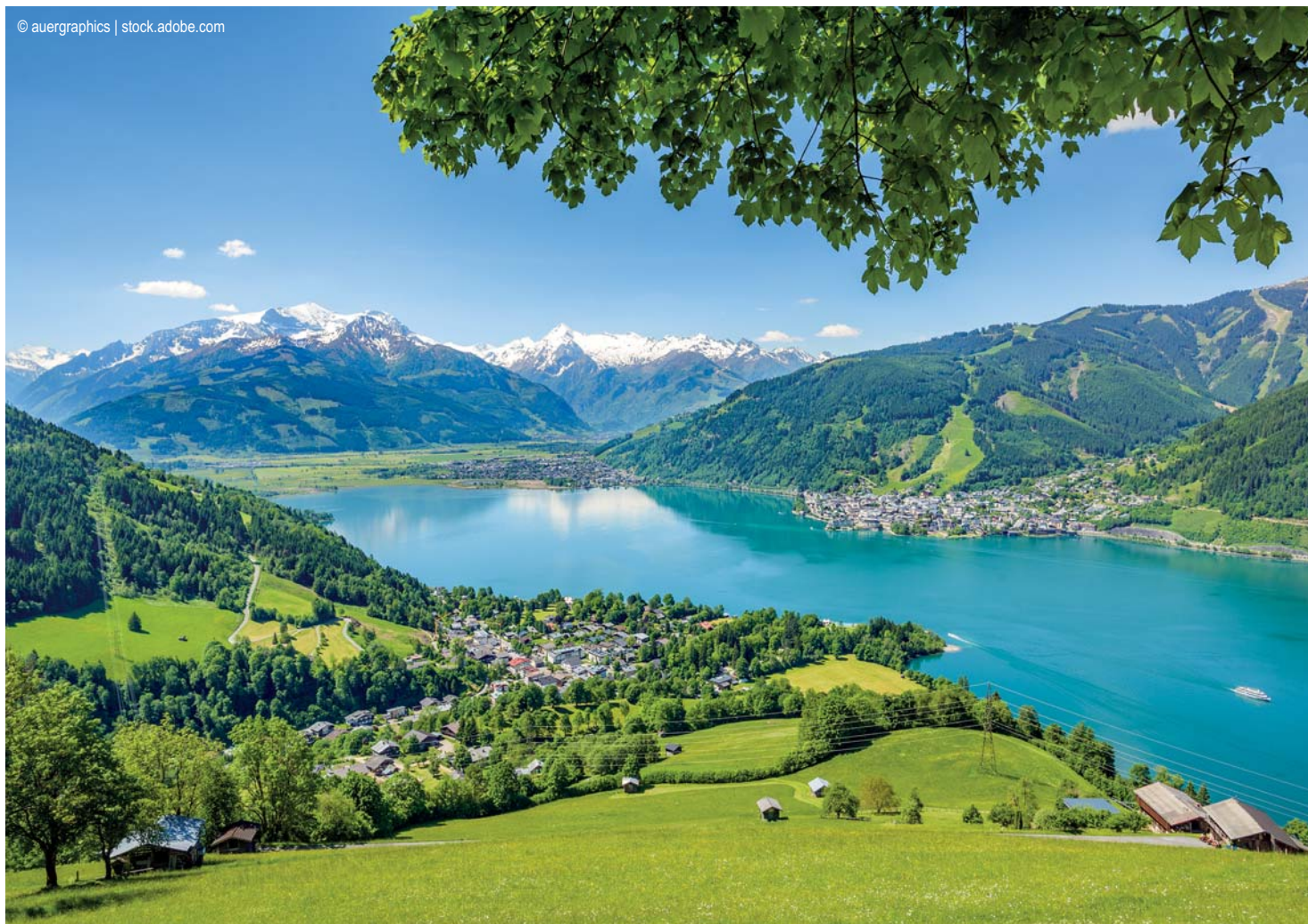
Zell am See