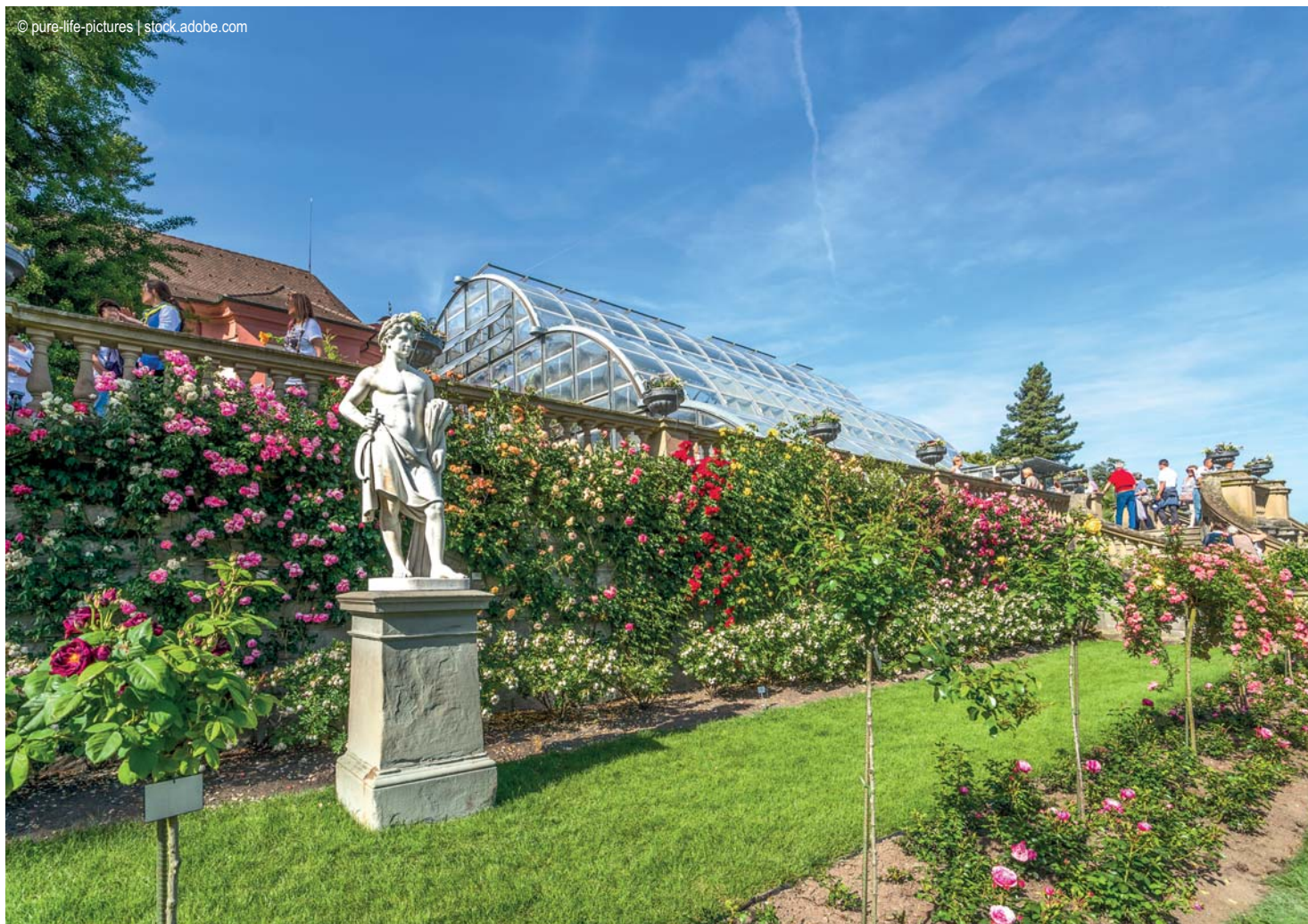
Mainau - Rosengarten