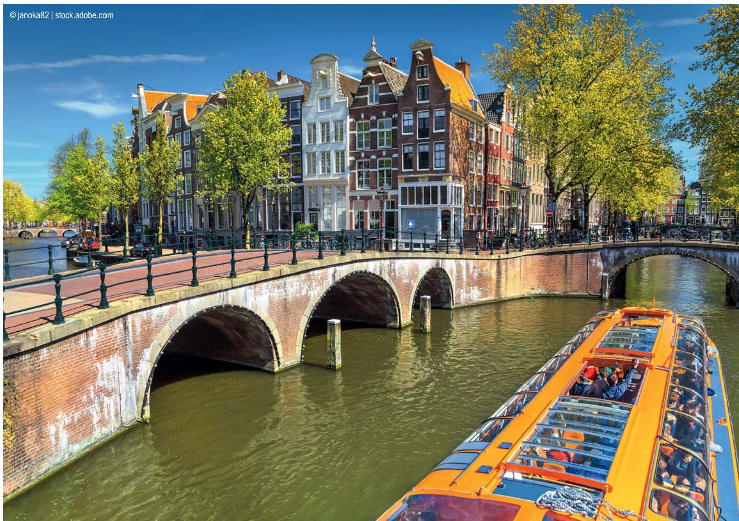
Amsterdam - Grachtenfahrt