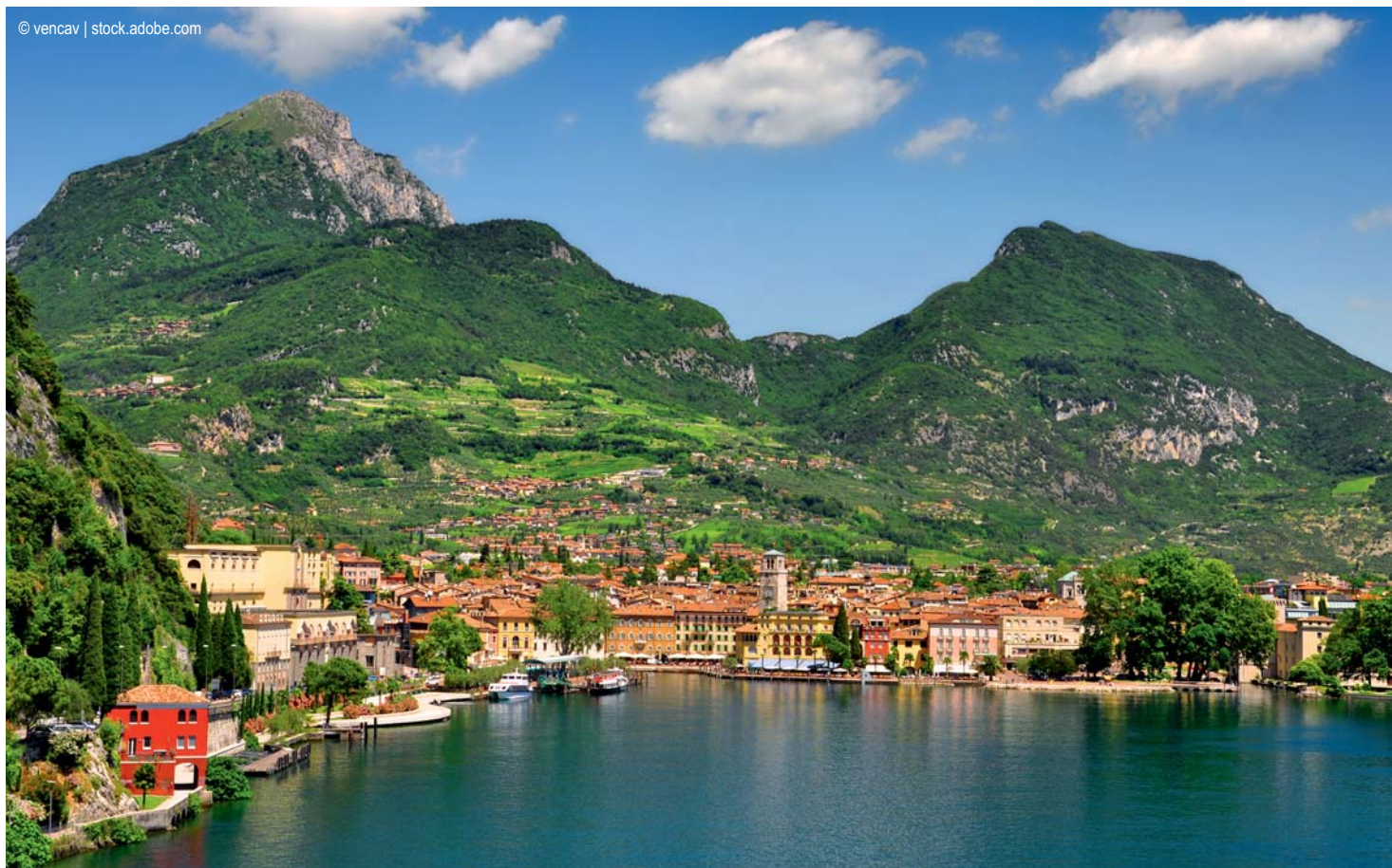
Riva del Garda