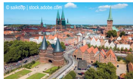
Lübeck - Holstentor

Gutes Mittelklassehotel in zentraler Lage in Lübeck. Alle Zimmer verstehen sich mit Bad/Dusche/WC, Fernseher etc.!