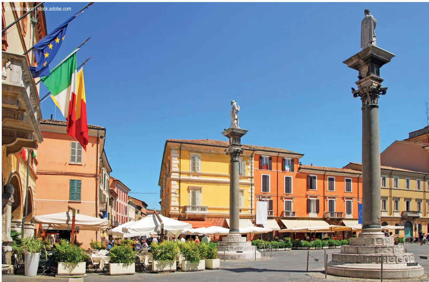
Ravenna - Piazza del Popolo