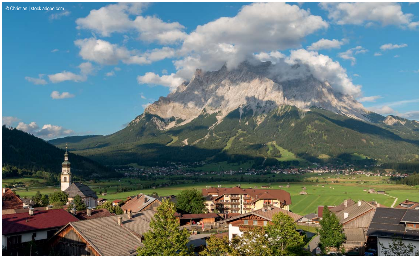
Lermoos - Zugspitze